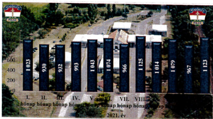
Közterületi jelenlét erő (fő) 2021. év havi adatai Nyírábrány Határrendészeti Kirendeltség